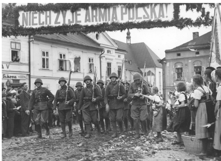
Polacy wkraczają na Zaolzie